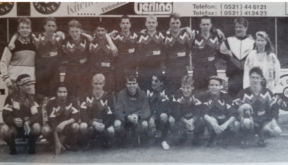
Die A-Junioren-Fußballer des TuS 08 Senne I feierten die Meisterschaft in der Kreisliga B und den damit verbundenen Aufstieg in die Kreisliga A.